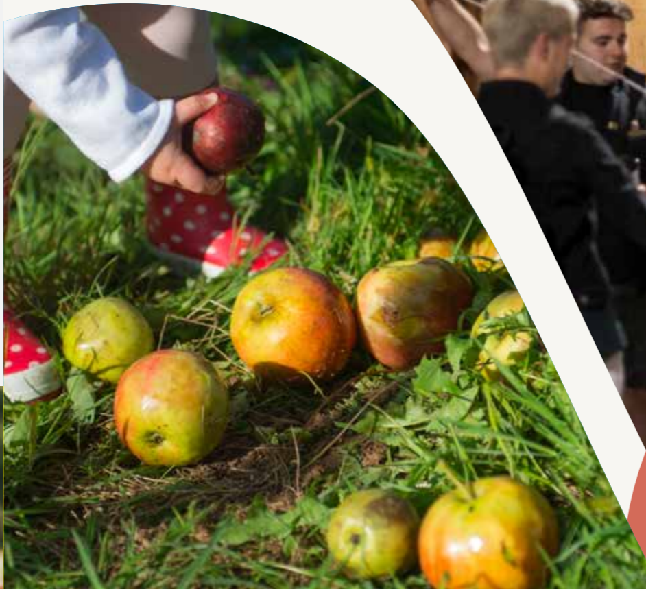
Bertako sagarra - Jatorria eta kalitatea Manzana autóctona - Origen y calidad Pomme locale - Origine et qualité Local apple - Origin and quality